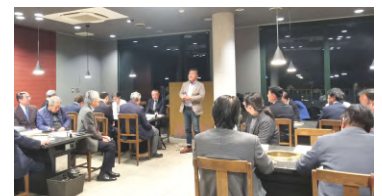
大久保地区委員会

1月28日開催:年頭にあたり会長から「蛇は脱皮を重ねて大蛇となるよう、私達も挑戦を重ね成長していきましょう」と挨拶があり、その後ビンゴ大会等を行い、和やかな雰囲気の中、参加者同士の親睦を深めました。23名参加