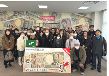
国立印刷局 彦根工場にて