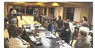
女性会新年交流会