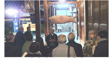
東宇治地区委員会