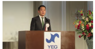
青年部 府青連会員大会