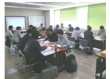
グループワークの様子

生産管理の概要と実際の事例紹介、ケーススタディやグループワークを通じて「気づき」や「考える力」を養成する今回のセミナーには、9事業所から16名が参加。講師からは「製造現場では、“工数を削減すること”が基本であり、そのために実際の作業を分析し、少しでも“ムダな工程を省く”ことによって、作業時間の短縮だけでなく、結果的に品質の向上にもつながり、お客様の購入機会が増加する。」との説明がありました。またグループワークでは、他社の受講者との意見交換等を通じて、今まで気づけなかった視点や管理手法などを知る良いきっかけになったとの声もあり、有意義なセミナーとなりました。