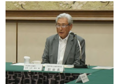
要望する山仲会頭