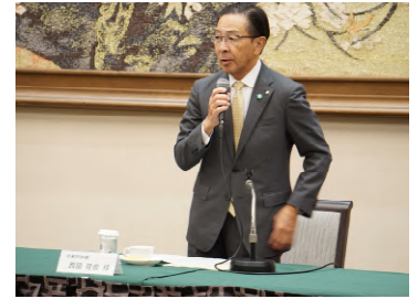
挨拶する西脇知事