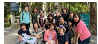
女性会日帰り研修会