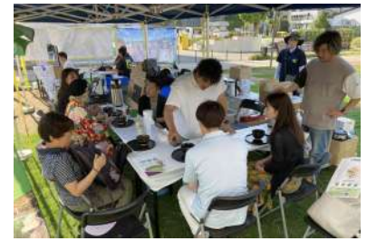
抹茶お点前体験ブース

9月4日には名古屋市「久屋大通公園」テレビターヒロバにて“京都・宇治PRキャンペーン”を開催、世界遺産平等院・宇治上神社をはじめ宇治の歴史や高級茶で名高い“宇治茶”の魅力を広く知ってもらうため、無料での“抹茶お点前体験”や水出しの“宇治茶ふるまい”のほか、「宇治玉露」を使用した“玉兎”や“大河ドラマ展チケット”を販売しました。来場者には無料抹茶体験を中心に好評で、引き続き各地で宇治の魅力PR活動を行う予定です。