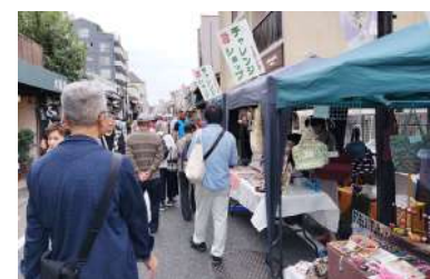
来場者でにぎわうフェスタの様子

当日は商工会議所からも「チャチャ王国のおうじちやま」が出演したほか、「ご当地グルメ宇治茶漬け」ブースと「チャレンジショップ」22店が参加。パレードやステージショーも行われ、1万人の来場者で終日にぎわいました。