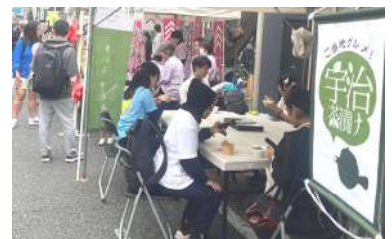
「宇治茶漬け」わんさかフェスタ出店