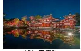
2019年までの夜間拝観の様子

詳細・申込に関しては平等院 Web ページ ( https://www.byodoin.or.jp/ ) をご覧ください。