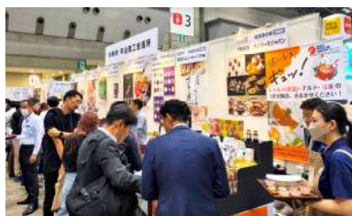
「FOOD STYLE Japan 2024」