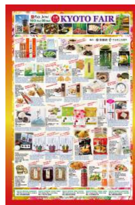
「カリフォルニア州 京都フェア 2024」